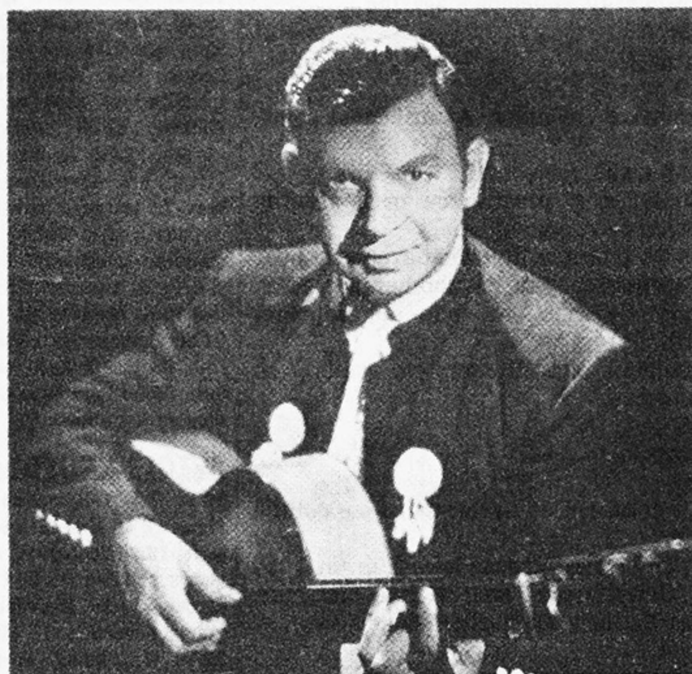
Augustin Castellon, alias Sabicas

Terugkerend bij de (overigens vrij onzinnige) vraag naar de beste gitarist ter wereld, komen we dus terecht bij een flamencogitarist die virtuositeit weet te combineren met persoonlijkheid en Kunst. De lijst met kandida-