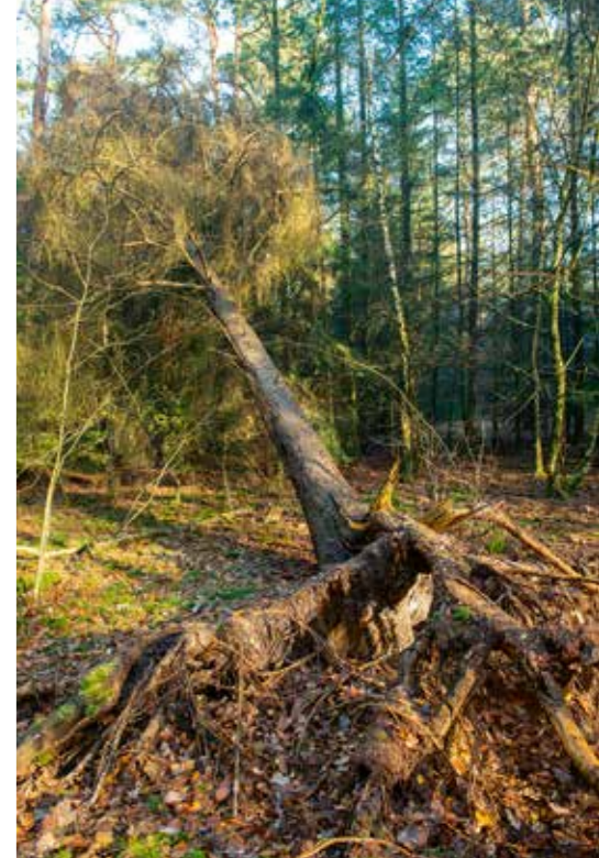
Door bomen met een lier om te trekken en te laten liggen ontstaat een varieerder bos met meer biodiversiteit.

Als die transitie rond de bovenloop van de Veldbeek al gemaakt kan worden, gaat dat veel inspanningen vergen en ook veel geld. Veldhuis denkt dat reële mogelijkheden om de Veldbeek lekker te laten meanderen en bij piekafvoer te laten overstroomen een paar kilometer stroom-