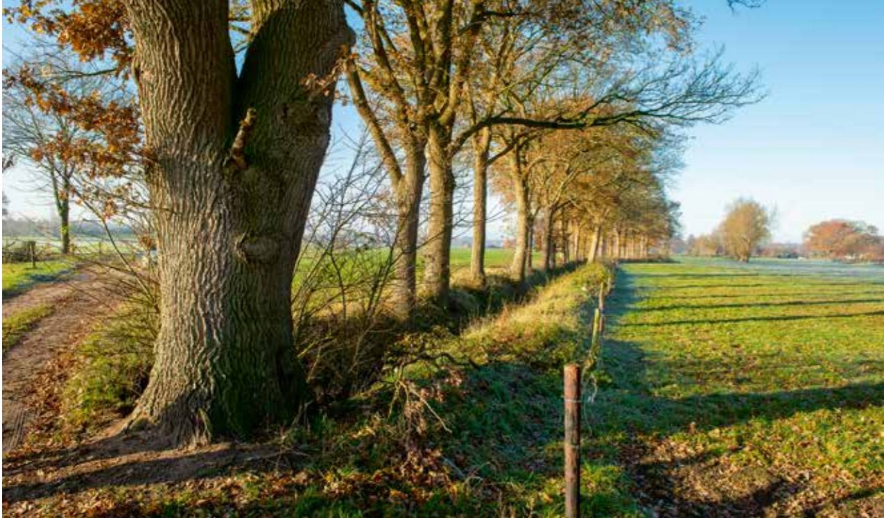
De prachtige eiken houtwal langs de Veldbeek als toekomstige ecologische verbinding met de Utrechtse Heuvelrug.