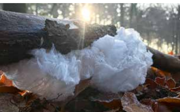
Ijshaar, een haarachtige, wollige ijsstructuur op dood loofbomenhout. Het natuurverschijnsel ontstaat bij een luchttemperatuur die even onder het vriespunt ligt.

'Ik geloof in natuur, het is deel van ons mens-zijn'